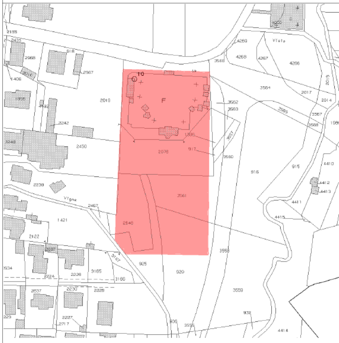
Estratto Mappa - scala 1:2000